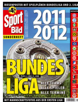
Saison 2011/2012 Neu!

Die Fußball-Fans können sich auf das SPORT BILD SONDERHEFT BUNDESLIGA 2011/2012 freuen. Es erscheint in neuer Form und Aufmachung mit zusätzlicher DVD „100 schönsten Tore“. Inhaltlich bietet es alle Infos zu den Teams, Spielern und Terminen sowie tolle Mannschaftsfotos. Der Abverkauf wird durch TV-Spots und Anzeigen unterstützt. Das druckfrische KICKER BUNDESLIGA SONDERHEFT wurde vom Verlag für den 20. Juli angekündigt.