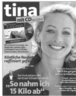
Mit CD Neu!

Rechtzeitig zum Valentinstag erscheint TINA Nr.8 in zwei Versionen mit und ohne CD. Die CD-Version zum VKP von 2,50 € ist mit bekannten Love-Songs von Chris Rea, Chris Norman, Simply Red und anderen Interpreten ausgestattet.